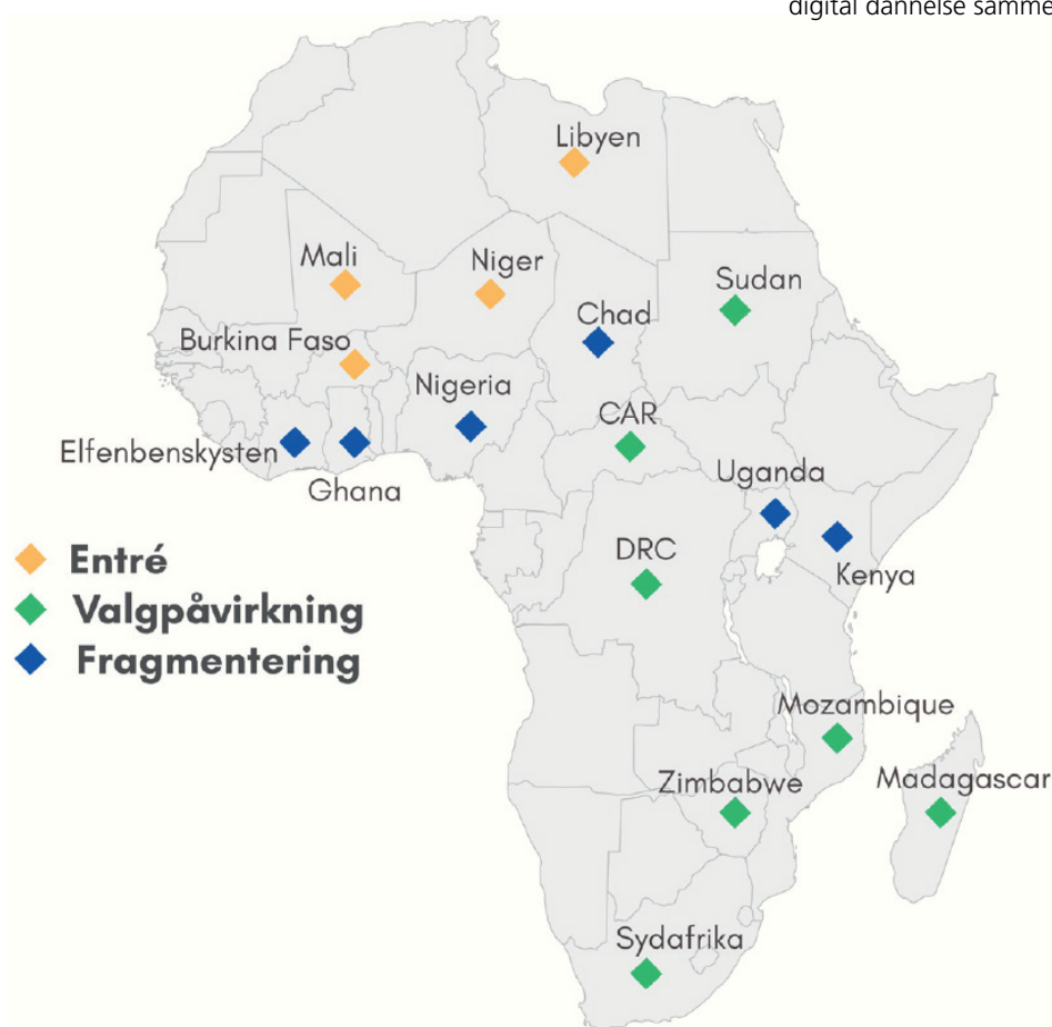
Figuren viser et kort over Afrika med en oversigt over lande, der oplever forskellige typer af russiske indflydelseskampagner. Typene entré, valgpåvirkning og fragmentering er ikke gensidigt udelukkende, men skal ses som et analytisk værktøj til at kortlægge russisk aktivitet og give indsigt i, hvordan og i hvilke kontekster Rusland søger at få politisk indflydelse i afrikanske lande.

Der er bred enighed blandt vestlige aktører om at gode redskaber til at imødegå de udfordringer, som det stigende antal russiske indflydelseskampagner indebærer, er at styrke kapaciteten indenfor monitorering, fact-checking, kritisk journalistik og digital dannelse sammen med partnere i og uden for Afrika.