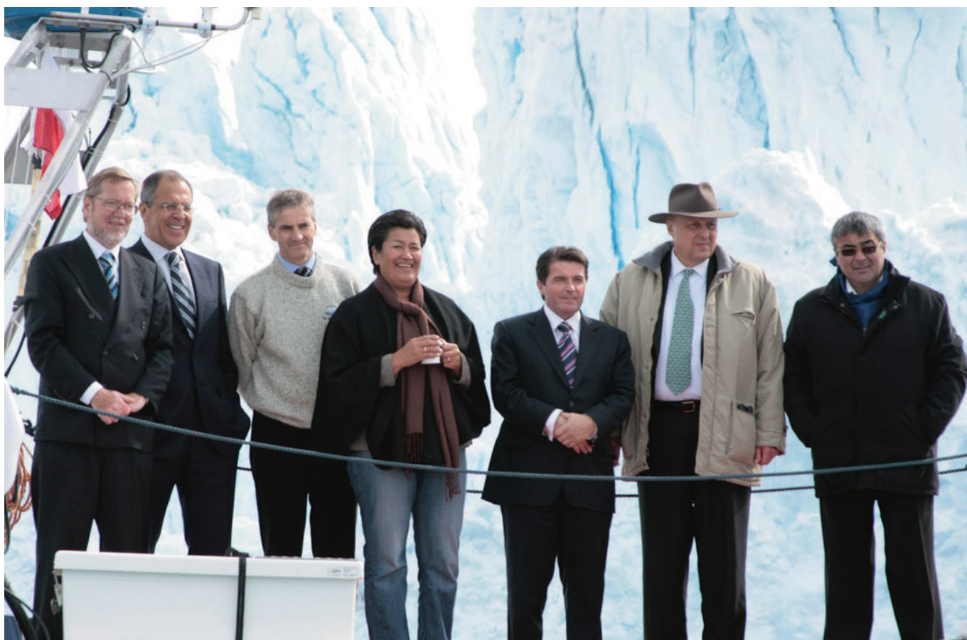
Fra venstre: Danmarks daværende udenrigsminister Per Stig Møller, Ruslands udenrigsminister Sergey Lavrov, Norges daværende udenrigsminister Jonas Gahr Støre, Grønlands daværende minister for udenrigs- og finansnliggende Aleqa Hammond, Canadas daværende minister for naturressourcer Gary Lunn, USA's daværende viceudenrigsminister John Negroponte og Grønlands daværende landsstyreformand, Hans Enoksen til mødet i Ilulissat d. 27.-29. maj, 2008.

Ilulissat-initiativet fik to overordnede konsekvenser. For det første var det sammen med en række andre indsatser og initiativer med til at tage luften ud af idéen om en arktisk traktat. Dermed styrkedes de arktiske staters position. For det andet var mødet med til at etablere A5 som et regionalt forum for spørgsmål relateret til Polarhavet (det Arktiske Ocean). I årene lige efter Ilulissat-initiativet frygtede flere aktører, at A5 ville blive en konkurrent til Arktisk Råd, hvilket skabte spændinger i det regionale samarbejde. Særligt Island og de oprindelige folks organisationer var kritiske over for A5. I 2010 slog USA fast, at A5 ikke skulle være en konkurrent til Arktisk Råd. A5-samarbejdet er da også fortsat som et praktisk og inkluderende forum på embedsmandsniveau for specifikke emner, såsom fiskeri i Polarhavet og afgrænsningen af kontinentalsoklen. Flere af A5's kritikere har stiltiende accepteret det som en del af den arktiske orden. Begge disse udviklinger var i Danmark, Grønland og Færøernes interesse, og for Rigsfællesskabet har Ilulissat-initiativet været en succes.